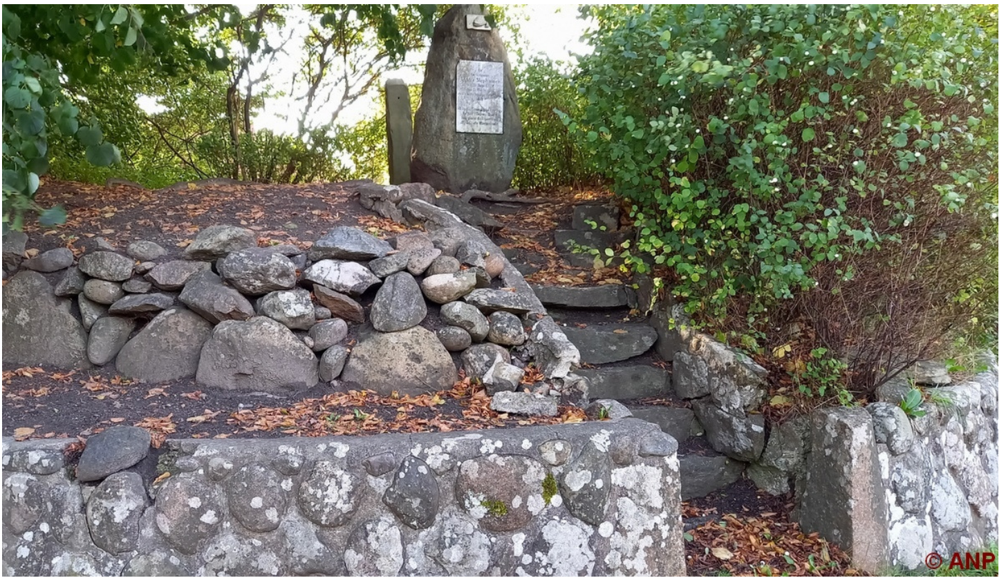
Foto fra 27/9. 2020 - Mindesteneen i det anlagte anlæg