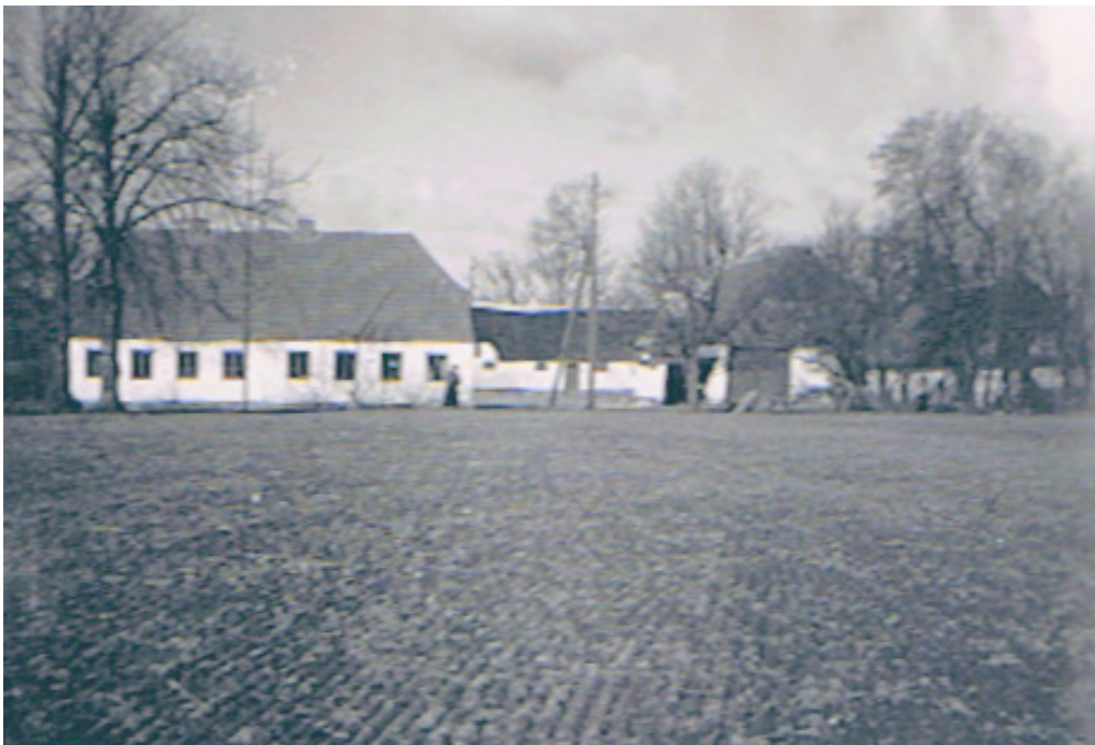
Matr.nr. 4a - Skelkærgård ca. 1940.