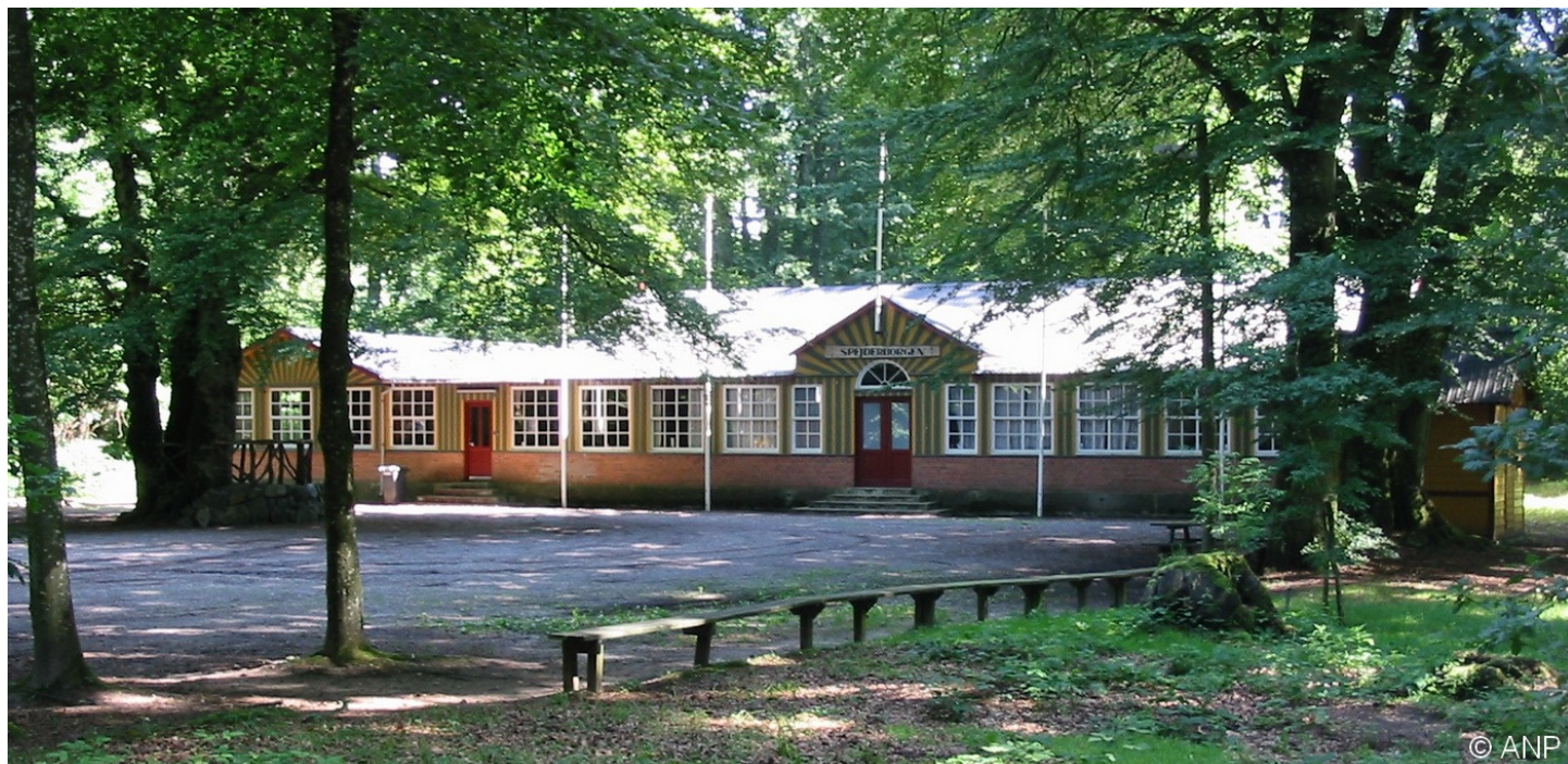
Pavillon 2008 - antageligt opført samme sted som paulunet således at den gamle kælder derunder kunne genbruges

Af gamle referater tyder det på, at første gang grundlovsfesten kunne holdes i det nye festtelt, Paulunet, var i 1855. Første gang Paulunet nævnes i indbydelsen til Grundlovsfesten er dog i 1856.