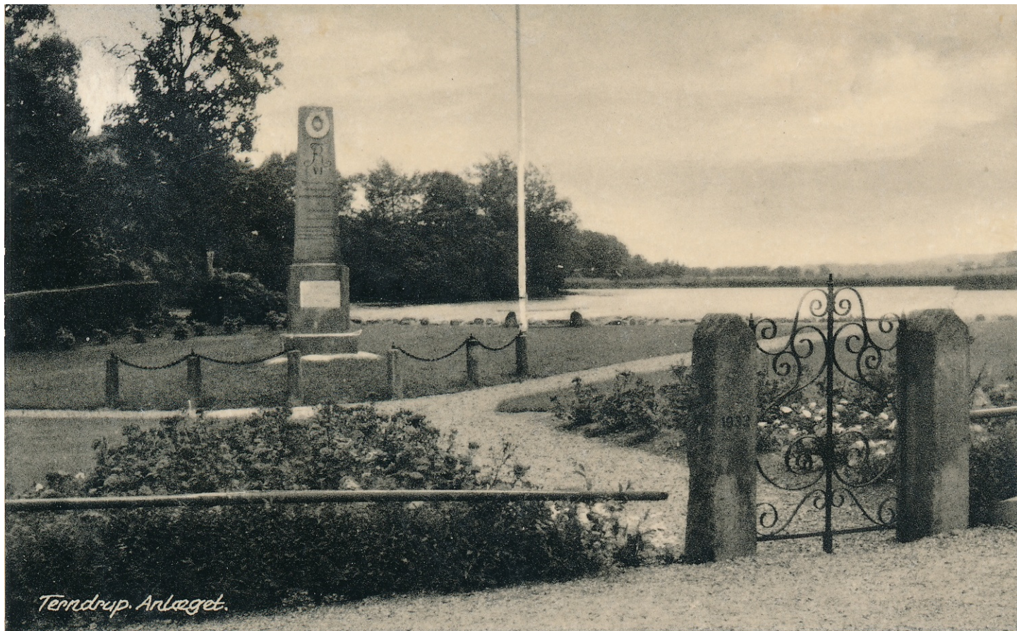
Mindestenen i anlægget (1956) ved møledammen efter flytningen i 1930'erne.

Dannebrogflagene, hvori Stenen var indhyllet, hejsedes nu, og foran den store Forsamling stod en smukt tilhugget Sten, 7 Fod høj, rejst paa en Sokkel af Beton, med følgende Inskription: