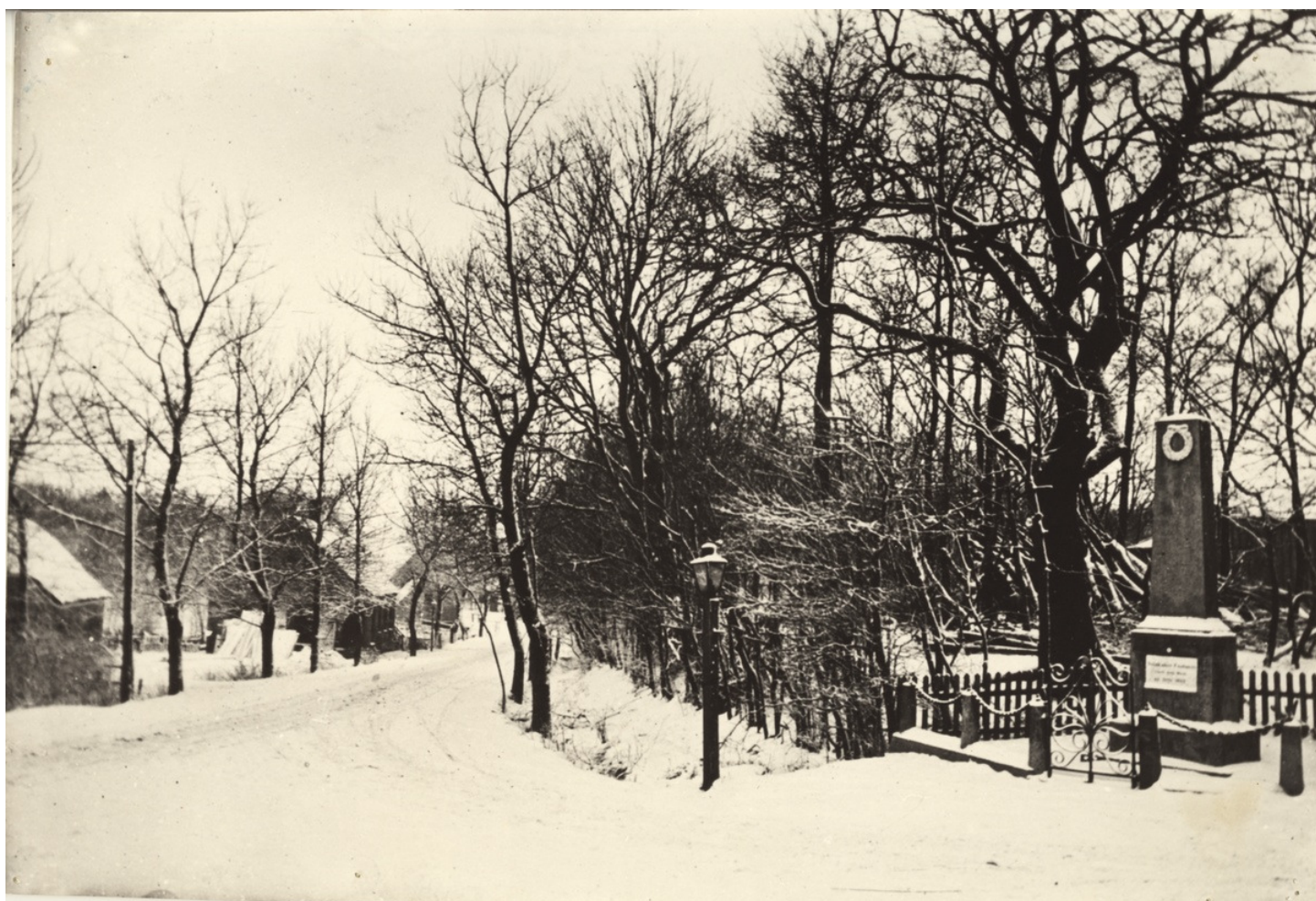
Mindestenen i det meget gamle Terndrup.

Det lille smukke Krat østen for Terndrup var i Dag Samlingssted for en Fest af en saa storartet Karakter, at næppe nogen tidligere Fest har kunnet opvise et endog tilnærmelsesvis saa stort Antal Deltagere. Se sidste Dages milde Vejr satte jo lidt Humør i Landboerne, og da Frihedssindet her paa denne Egn er dybt rodfæstet, var det naturligt, at unge og gamle i dyb Forstaaelse af det stor Slag, der blev slaaet af gode Patrioter for Danmarks Bondestand for om ved 100 Aar siden, samledes for med Glæde og Tilfredshed i Hjærtet at mindes Kampens Resultat, der kundgjordes ved Forordn. af 20. Juni 1788 ang. Stavnsbaandets Ophævelse.