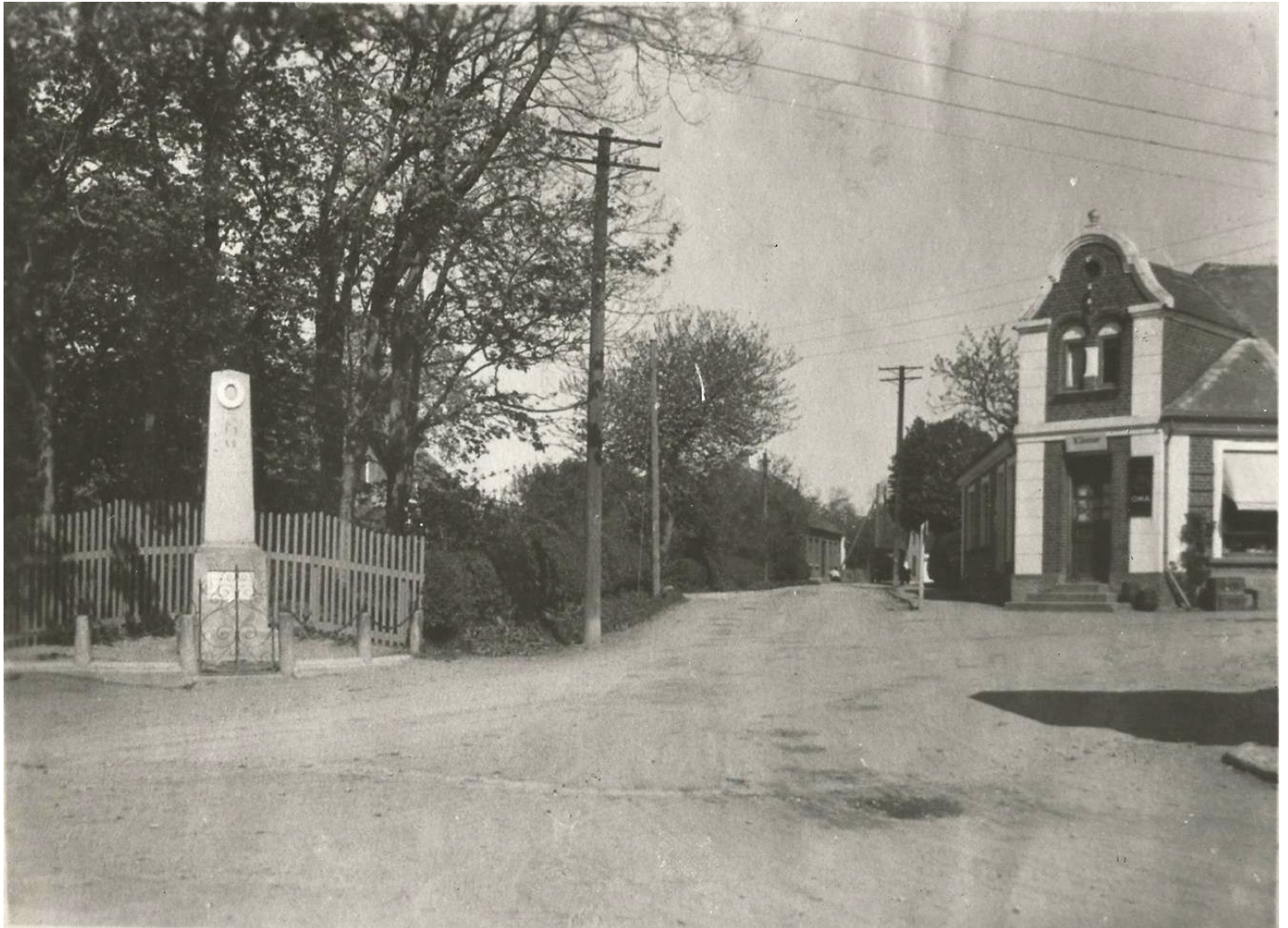
Mindestenen ved doktorboligen, hvor den blev placeret i 1888 (foto fra 1928)